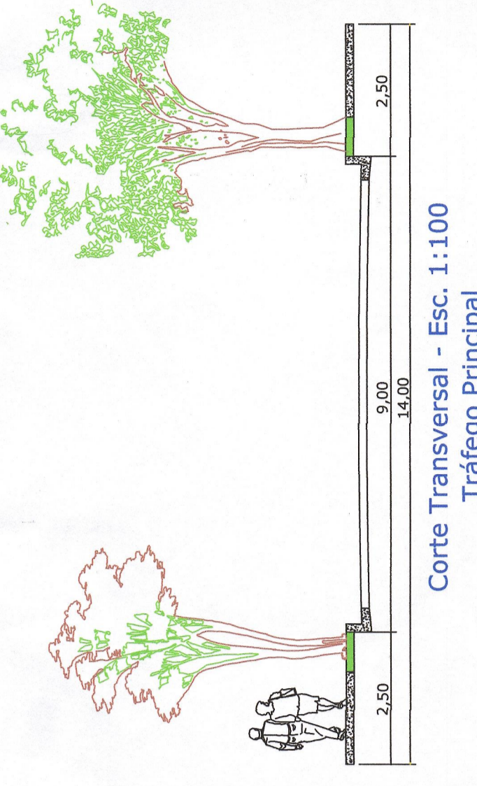
Corte Transversal - Esc. 1:100 Tráfego Principal